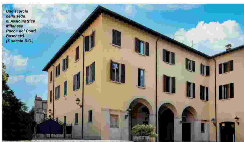
Uno scorcio della sede di Assicuratrice Milanese Rocca dei Conti Boschetti (X secolo D.C.)

Leader nelle soluzioni di polizze di Responsabilità Civile Professionale Medica , con un ventaglio di soluzioni complete in grado di soddisfare tutte le esigenze dei professionisti del comparto, Assicuratrice Milanese affianca al prodotto un servizio di supporto costante al sottoscrittore di polizza, attraverso soluzioni pensate ad hoc per rispondere alle singole necessità del cliente. Ne è un esempio il « Pronto Soccorso del Diritto », un servizio gratuito di consulenza legale rivolto a tutti i professionisti sanitari assicurati che abbiano stipulato anche una polizza di Tutela Legale e che ne-