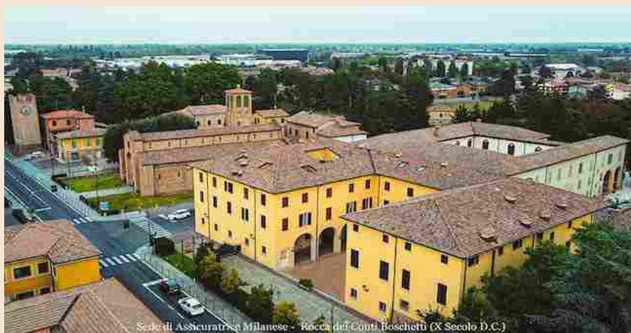
Sede di Assicuratrice Milanese - Rocca dei Conti Boschetti (X Secolo D.C.)